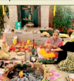
लखनपुरी में कनिष्क इंडस्ट्रीज में हवन पूजा के बाद हुआ मंडार

सरोना। महाशिवरात्रि के पावन अवसर पर नरहरपुर तहसील के ग्राम जामगांव में भक्ति और सेवा का अनूठा संगम देखने को मिला। कार्यक्रम का शुभारंभ भगवान शिव की विधि-विधान से पूजा-अर्चना और जलाभिषेक के साथ हुआ। मंदिर परिसर में भक्तों का भीड़ लगा रहा, जहाँ श्रद्धालुओं ने कतारबद्ध होकर महादेव के दर्शन किए। इस दौरान आयोजित रामायण मंडली के सुमधुर मंजनों और मानस पाठ ने पूरे गांव के वातावरण को आध्यात्मिक ऊर्जा से सशरभ कर दिया। हर-हर महादेव के जयकारों से पूरा क्षेत्र गूंज उठा। विश्व हिंदू परिषद और बजरंग दल के विशेष सहयोग से भव्य मंडार का आयोजन किया गया। शिव सेवा समिति के पदाधिकारी, विश्व हिंदू परिषद, बजरंग दल, दुर्गा वहिनी के पदाधिकारी व सदस्य उपस्थित रहे।