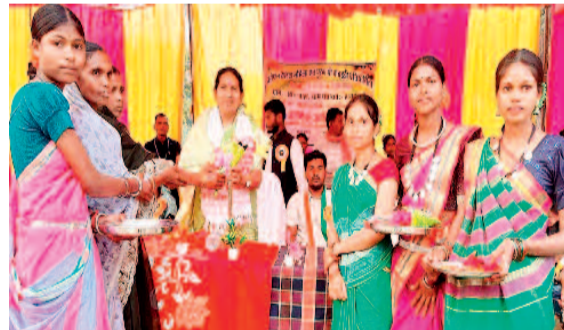
हरिभूमि न्यूज &gt;&gt;&gt; दुर्गकोदल

देखने को मिला। ग्रामीणों ने बताया कि अजादी के बाद पहली बार किसी विधायक का गांव में आगमन हुआ है, जिससे पूरे गांव में खुशी और गर्व का माहौल बना। ग्रामीणों ने पारंपरिक रीति-रिवाजों के साथ विधायक का स्वागत किया और अपनी समस्याएं व मांगें उनके समक्ष रखीं। ग्रामीणों की मांग पर विधायक ने देवस्थल में टीनशेड निर्माण हेतु 10 लाख रुपये तथा खुला रंगमंच निर्माण के लिए 3 लाख रुपये की घोषणा की। उन्होंने आश्वासन दिया कि गांव की आवश्यक सुविधाओं एवं विकास कार्यों को प्राथमिकता के साथ पूरा किया जाएगा, ताकि ग्रामीणों को बेहतर आधारभूत सुविधाएं मिल सकें।