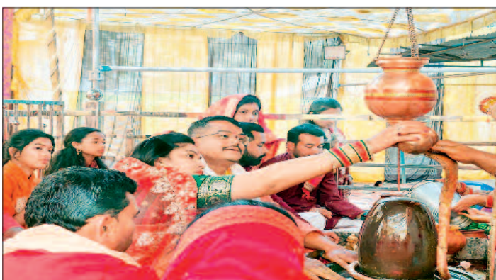
विवाहोत्सव की दिव्य कथा का भावपूर्ण श्रोता भावविभोर हो उठे और पूरा पंडाल वाचन किया। उनके ओजस्वी प्रवचन से

महाशिवरात्रि के पावन अवसर पर श्री श्री बटुकेश्वर महादेव सेवा समिति, सिविल लाईन कॉलोनी, माहुरबंदपारा के तत्वावधान में आयोजित शिव कथा के तीसरे दिन श्रद्धा और भक्ति का अद्भुत संगम देखने को मिला। कथा व्यास आचार्य पंडित