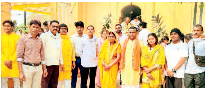
हरिभूमि न्यूज &gt;&gt;&gt; कांकेर

महाशिवरात्रि के पावन अवसर पर रविवार की सुबह कांकेर शहर से लेकर ग्रामीण अंचलों तक शिवभक्ति की अद्भुत छटा देखने को मिली। हर-हर महादेव के जयघोष से वातावरण गूंज उठा और मंदिरों में उमड़े श्रद्धालुओं ने आस्था, श्रद्धा और भक्ति के साथ भगवान