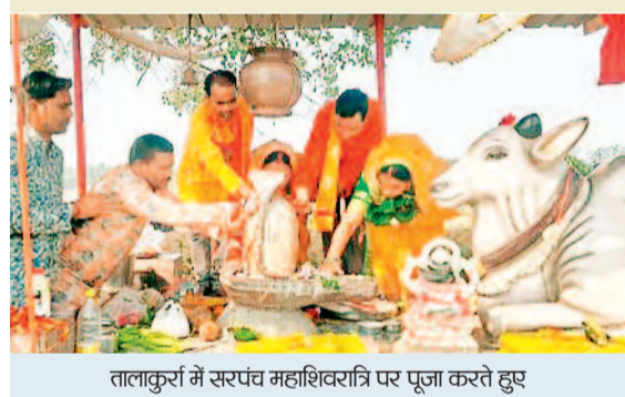
तालकुरा में सरपंच महाशिवरात्रि पर पूजा करते हुए